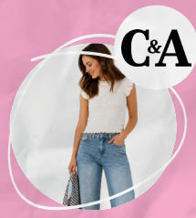
Ensemble Denim Casual