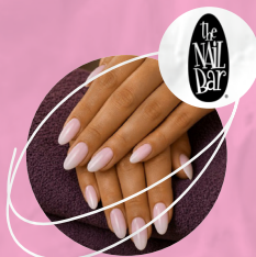
Deluxe Super Woman mains