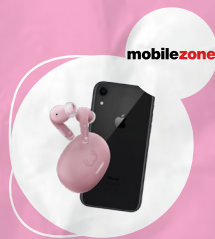
iPhone reconditionné et écouteurs