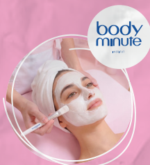
Soin visage Flash'Masque