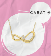
Collier Zirconia Argent 925